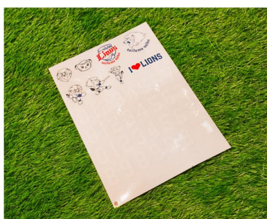
オリジナルステッカー付き