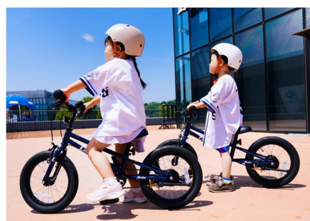
3歳～7歳まで長く乗れる