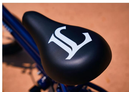
サドルに「L」のイニシャルマーク