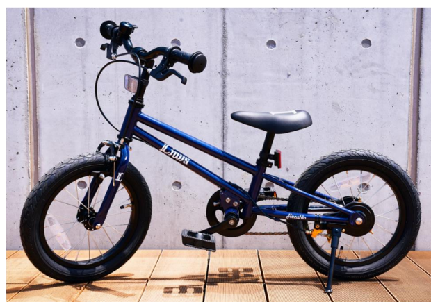
ペダルを付ければ自転車に変身